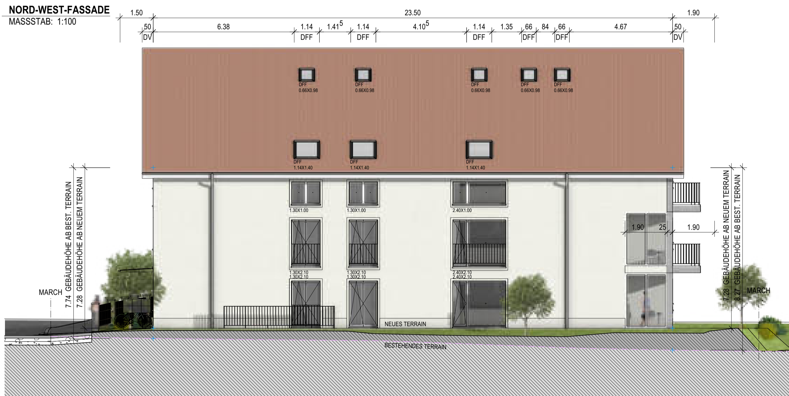
NORD-WEST-FASSADE MASSSTAB: 1:100