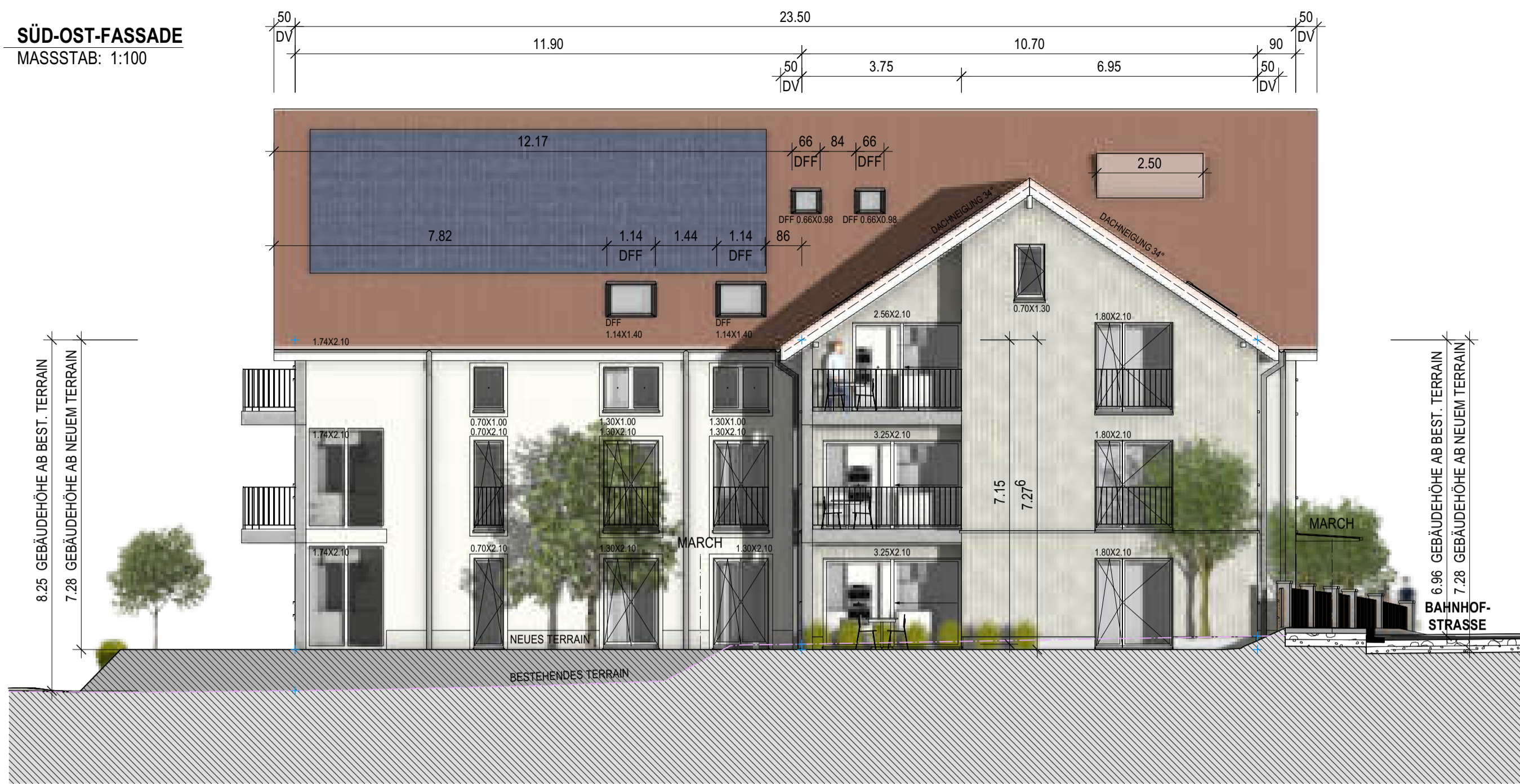
SÜD-OST-FASSADE MASSSTAB: 1:100