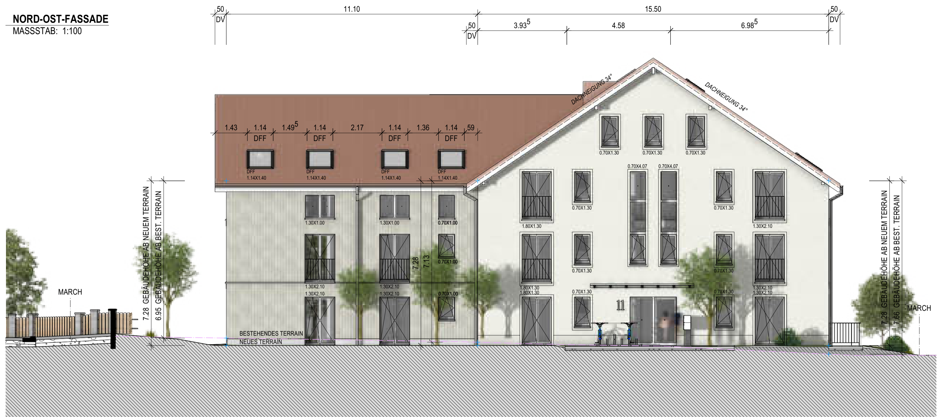
NORD-OST-FASSADE MASSSTAB: 1:100