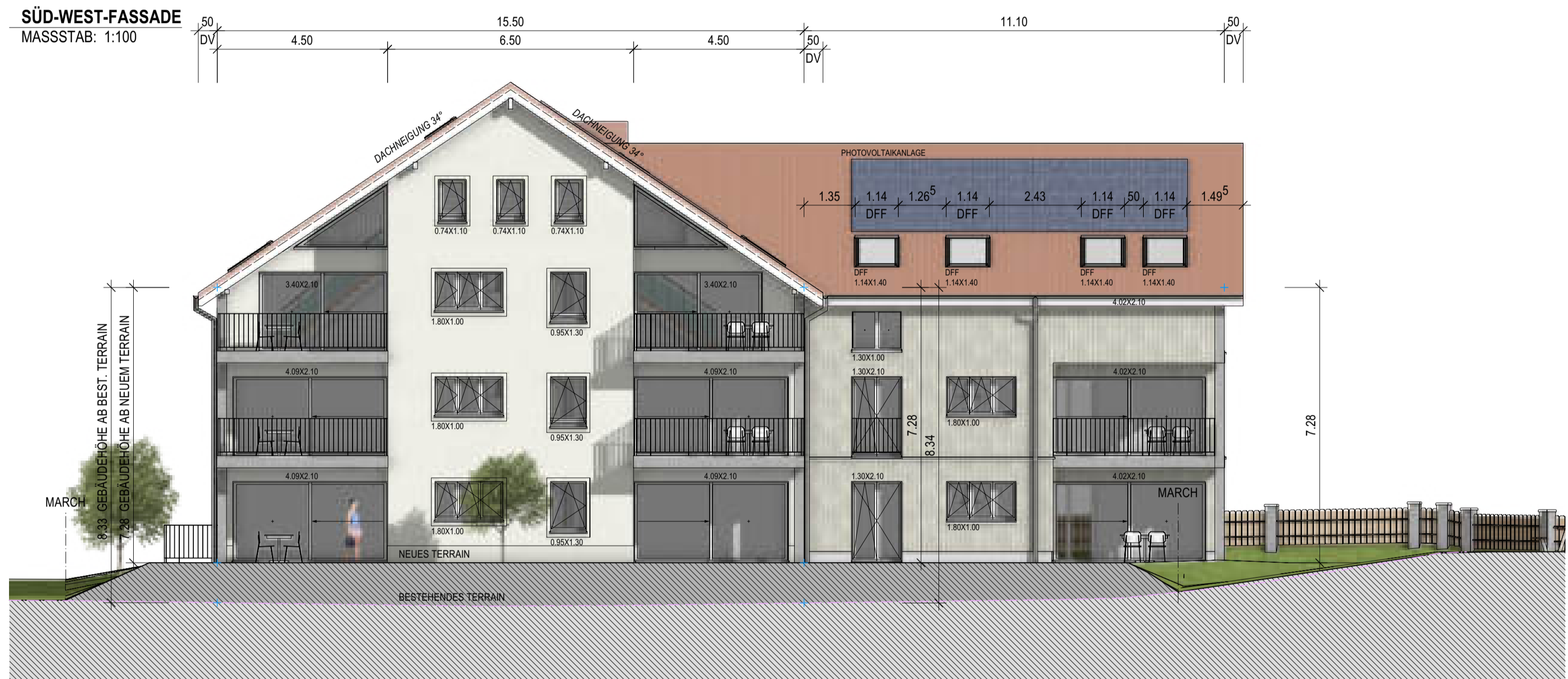
SÜD-WEST-FASSADE MASSSTAB: 1:100